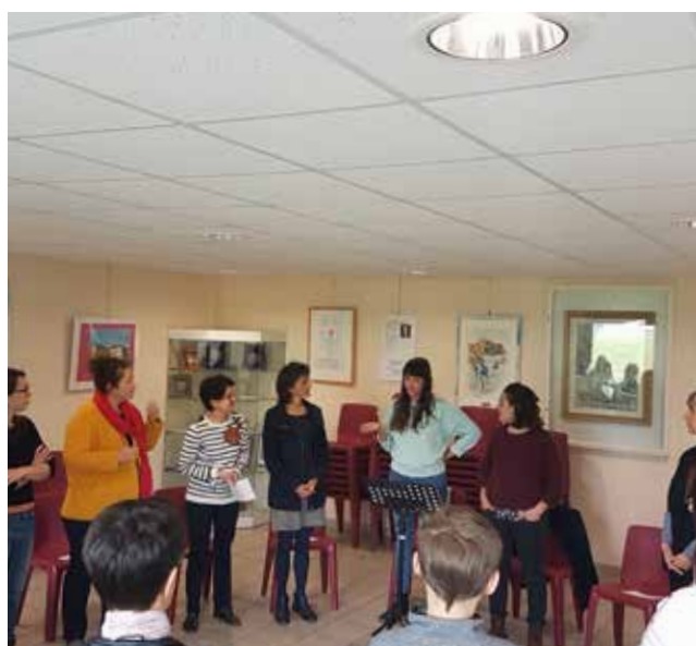
Atelier chant le matin même, salle Agordo