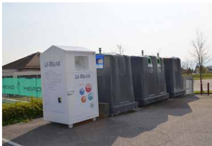
Une nouvelle benne de collecte de vêtements près de la salle des fêtes de Dolomieu

Le Relais est un réseau d'entreprises qui agit depuis 30 ans pour l'insertion de personnes en situation d'exclusion, par la création d'emplois durables. Membre d'Emmaüs France et de l'Inter Réseaux de la Fibre Solidaire (IRFS), il porte en lui les valeurs de solidarité et de générosité défendues par l'abbé Pierre. Il s'attache à lutter contre les causes d'exclusion, basant son action sur la conviction que le retour à l'emploi des personnes en difficulté est un moyen de les aider à préserver leur dignité, à retrouver leur autonomie financière et leur place dans la société. Il a développé pour cela plusieurs activités économiques, qui lui ont permis de créer plus de 2 200 emplois.