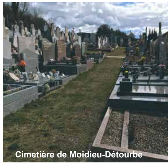
Cimetière de Moidieu-Détourbe

Tous concernés, renseignez-vous auprès du SICTOM