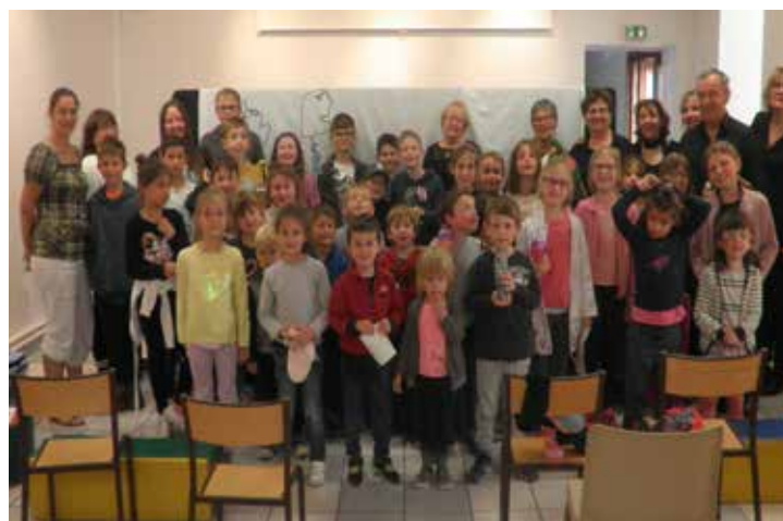
Mom' en contes à la médiathèque

L'Accueil de Loisirs de Dolomieu sera fermé du 5 au 18 août 2019 mais renseignez-vous auprès des VDD, d'autres centres sont ouverts.