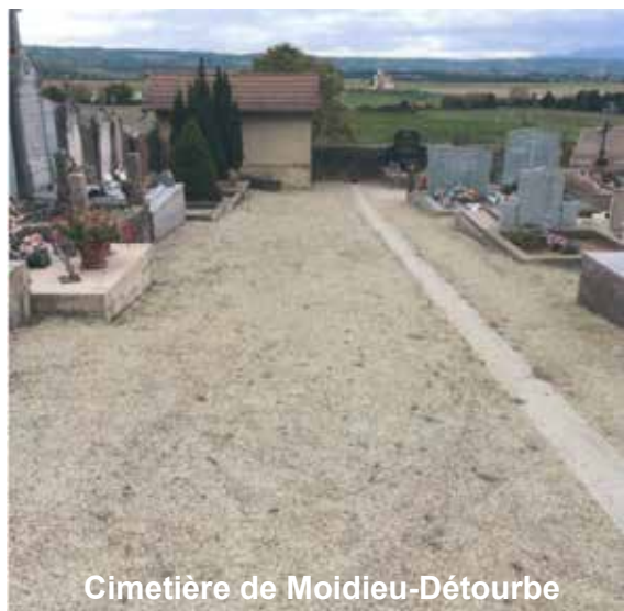
Cimetière de Moidieu-Détourbe

Une rencontre d'information et d'échanges est prévue le vendredi 13 septembre à 16h30 en présence de l'entreprise qui réalisera les travaux. Si vous êtes intéressés : Date limite d'inscription le samedi 14 septembre, en mairie ou par mail communication@dolomieu.fr