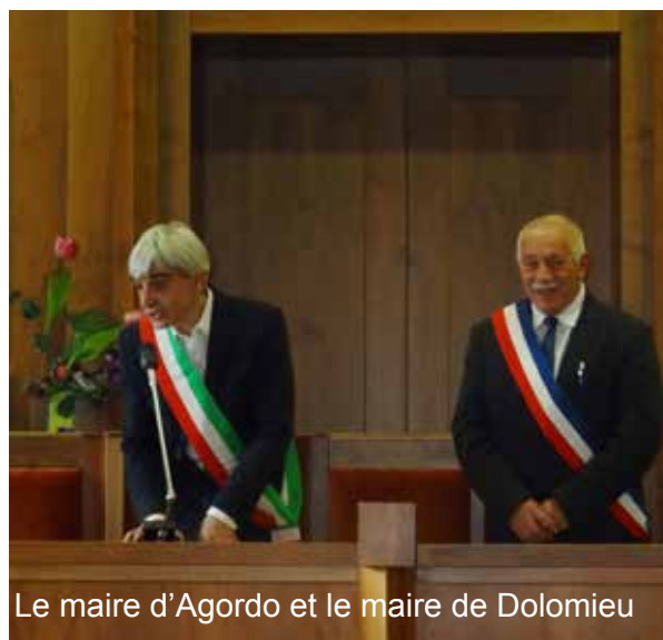
Le maire d'Agordo et le maire de Dolomieu