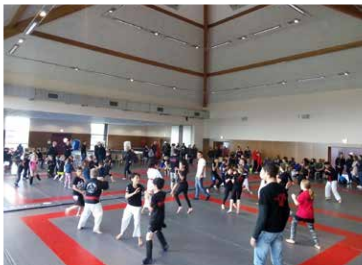
La rencontre amicale du 12 mai

8 compétiteurs ont participé aux championnats régionaux, et une vingtaine d'adhérents étaient présents lors de la rencontre amicale organisée par le club le 12 mai. Cette journée qui a regroupé 4 clubs et une soixantaine de participants s'est terminée par une remise de médailles pour chaque enfant.